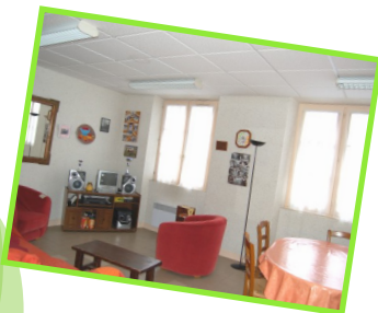
Des coins salons