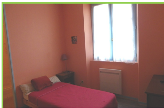
Des chambres individuelles avec salles d'eau