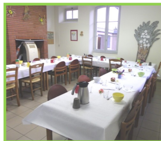
Une salle de restauration